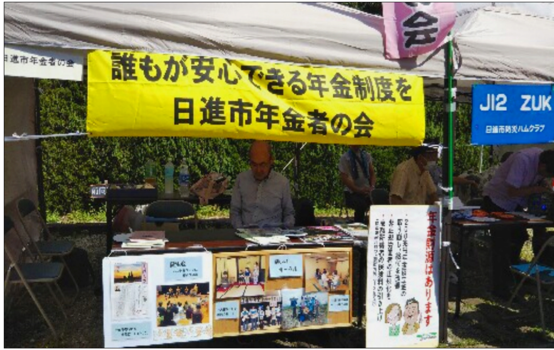
日進夢まつりで宣伝しました