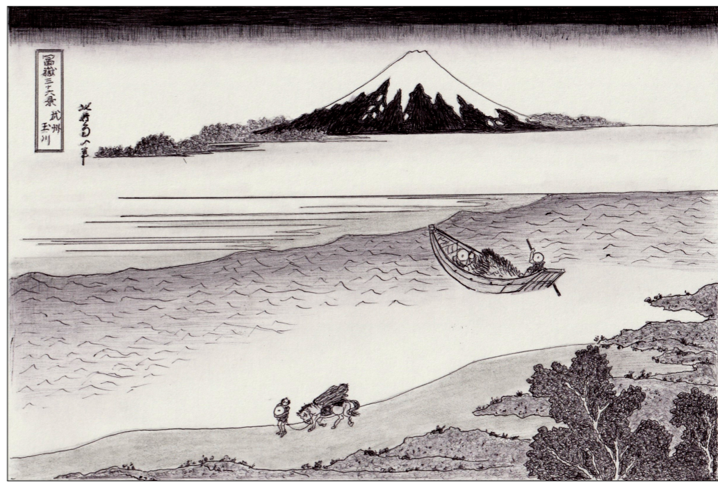
ポールペン画で観る「富嶽三十六景」 葛飾北斎「富嶽三十六景」より 画 曾雌 敦

(ぶしゅうたまがわ) 現在の多摩川の様子を描いた作品です。山梨から東京を経て神奈川に流れる多摩川ですが、この作品